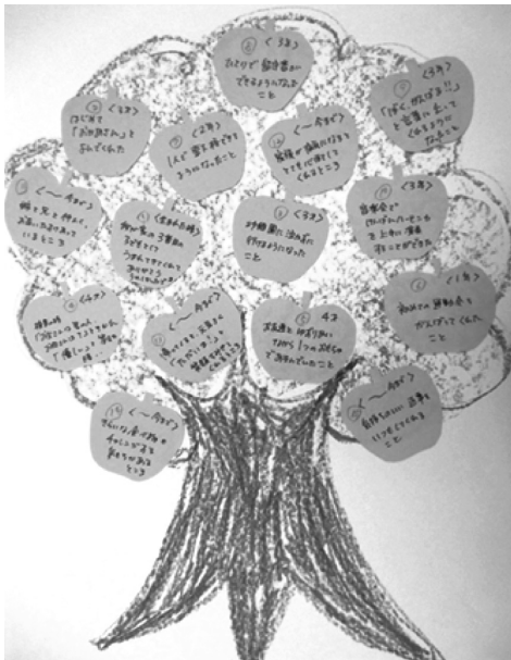
図1-1 「嬉しい実のなる木」の例

療育活動中の親の集団カウンセリングの時間帯で、15～20分間実施した。親たちに画用紙（白、B4サイズ）とクレヨン（緑色と茶色の2色）、リングの実の形の用紙（ピンク色、直径5cm程度）